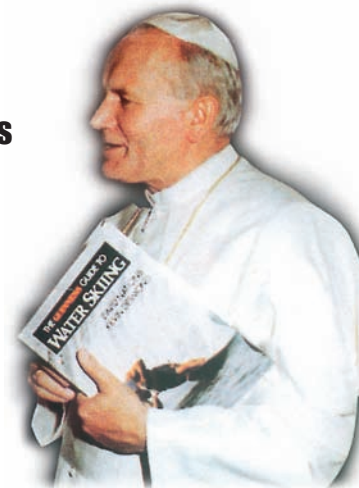
Die wahre Bibel

Die Geschichte des Wasserski-Sports Weltweit – Europa – Deutschland (Ost/West) mit Einsteigertipps